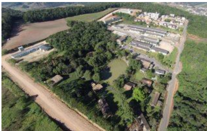
Figura 1 – Campus UNIBAVE Orleans – SC