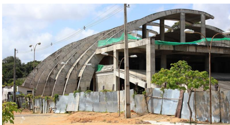
Figura 5: Atual situação do prédio que têm 97% da obra executada, entretanto os trabalhos encontram-se paralisados