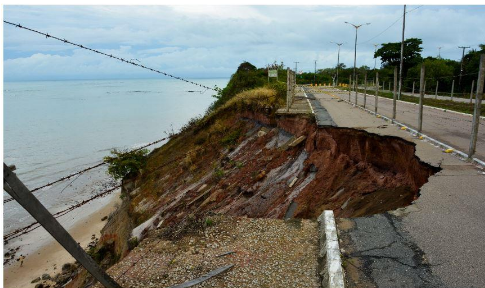
Figura 3: 2017.

O processo de desgaste de falésias é algo natural, mas com a urbanização desenfreada e o desmatamento da vegetação que é responsável pela sustentação e preservação, resulta em uma aceleração do processo de erosão, como podemos ver na imagem abaixo: