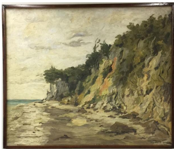
Figura 3. Hermano José. "CABO BRANCO". 1952. 69 x 82,5cm. Óleo s/tela – Acervo UFPB

Em maio de 2007, Hermano José é agraciado com a Comenda Verde da Assembleia Legislativa do Estado da Paraíba, como reconhecimento pelas iniciativas em defesa ao meio ambiente.