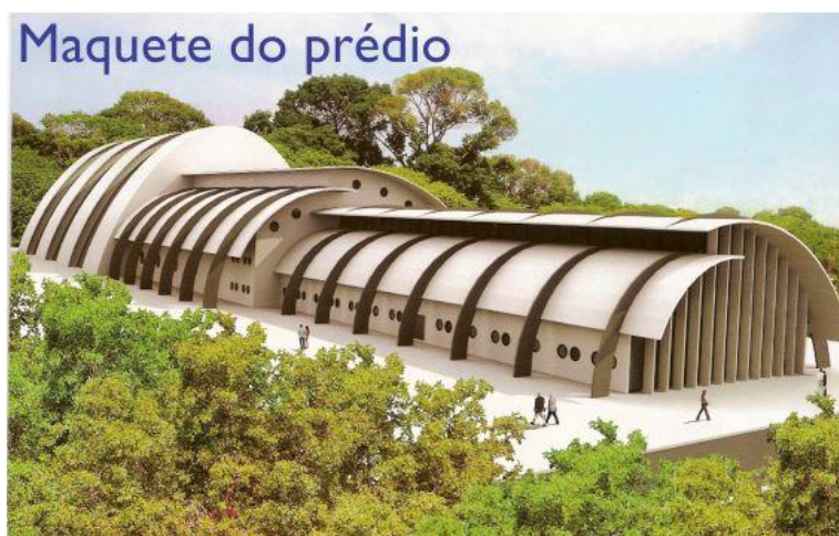
Figura 4: Maquete do Centro de Artes e Cultura da UFPB. Fonte: Espaço experimental. 2010.