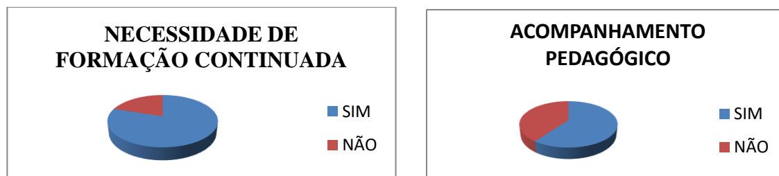
Figura 03- Resposta dos professores sobre formação e acompanhamento

A avaliação só será eficiente e eficaz se ocorrer de forma interativa entre professores e alunos, ambos caminhando na mesma direção, em busca dos mesmos objetivos. O aluno não será um indivíduo passivo; e o professor, a autoridade que decide o que o aluno precisa e deve saber. O professor não irá apresentar verdades, mas com o aluno irá investigar, problematizar, descortinar e, pelos erros, as melhores alternativas para superá-los.