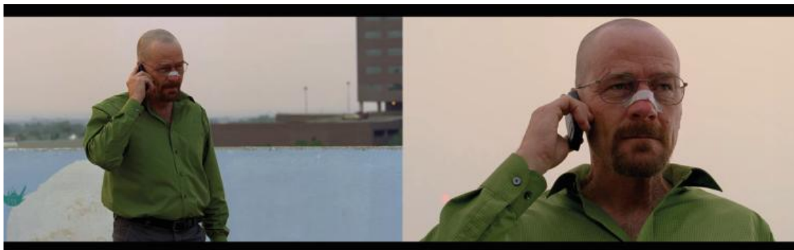
Figura 14 e 15: Episódio “Confronto”