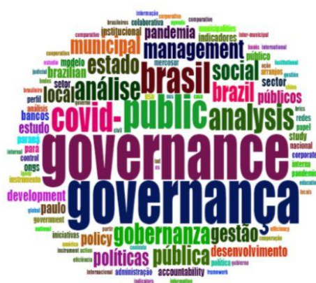
Figura 1. Nuvem de palavras

Esta seção sintetiza os principais resultados. A Figura 1 apresenta a árvore de palavras em torno das publicações sobre governança, que são as principais palavras identificadas. Logo, se observa-se que o termo “governance” e “governança” são os termos mais citados, seguido do termo “ governance public ” que também é destaque (3,5%), junto com os termos “brasil” (3%), analysis (3%) e covid (2,6%). É importante ressaltar também que os termos “local”, “desenvolvimento”, “estado”, “municipal”, “pública” e “social” são bem presentes, o que sinaliza sobre quais áreas as pesquisas são direcionadas.