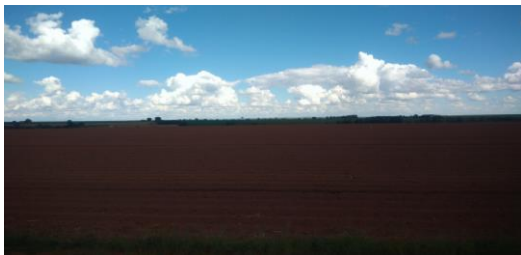
Figura 2. Relevo bem suavizado com áreas destinadas ao plantio em razão da fraca energia do relevo na Alta Bacia.

VI SIMPÓSIO DA AGRONOMIA IV SIMPÓSIO DA ENGENHARIA FLORESTAL