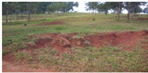
Figura 3. Perfis de solo pouco espessos e potencial erosivo diante morfogênese ativa, efeito da forte energia do relevo.